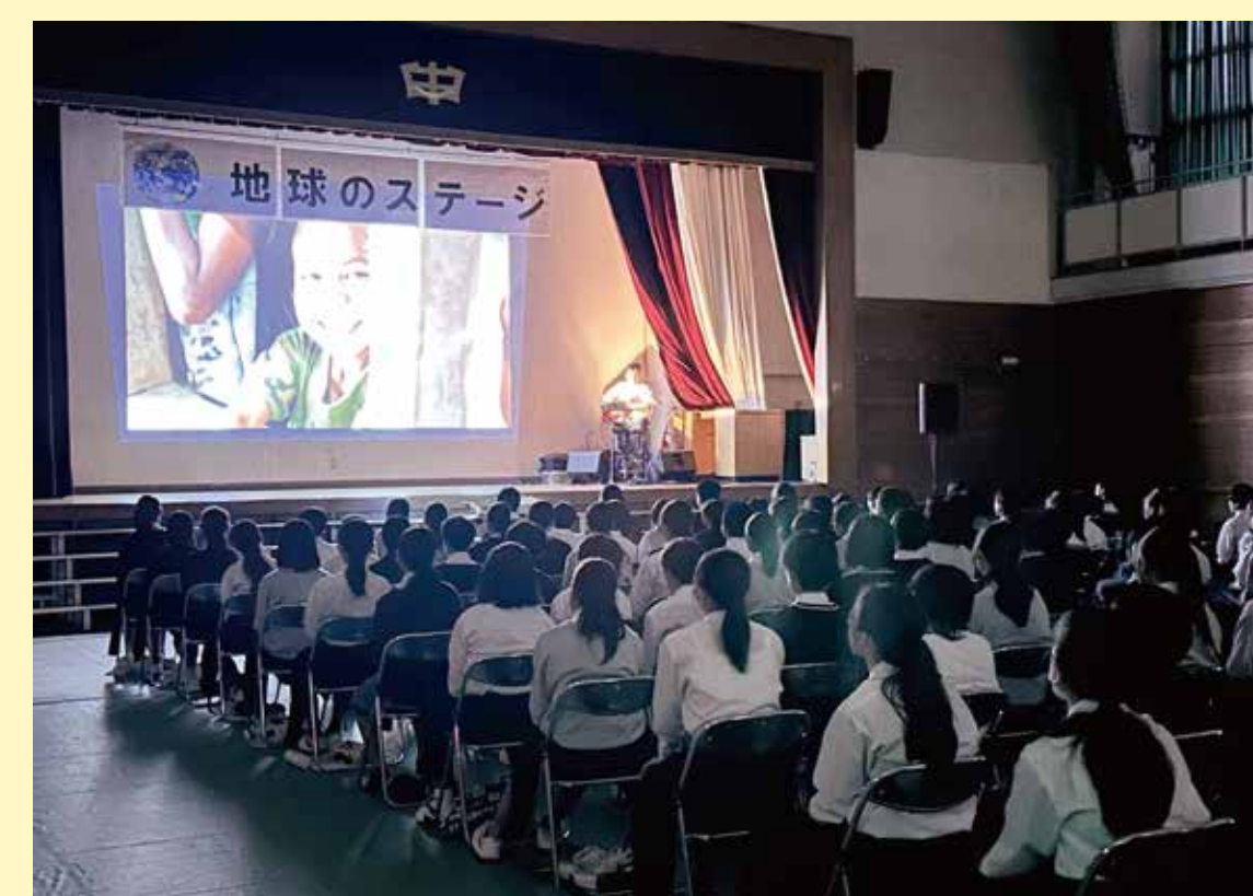
中学校で開催された「地球のステージ」(3地区)