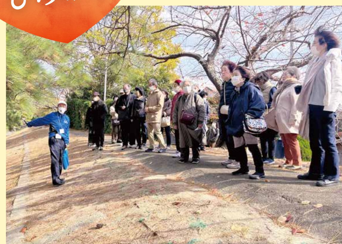
バスで行く防災学習会(2地区)