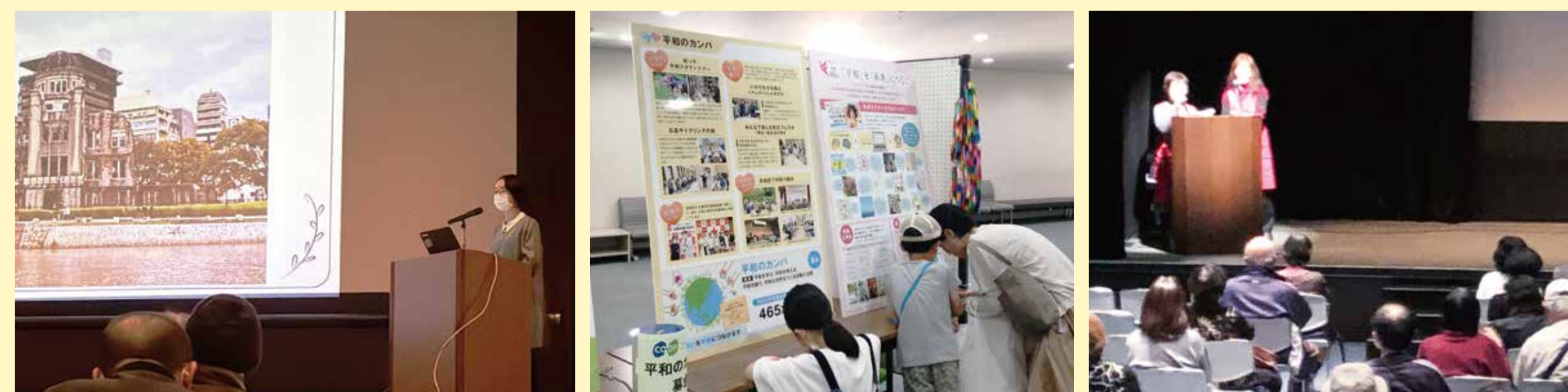
映画の前に平和の旅を報告する学生