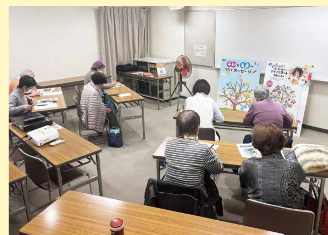
「島守の塔」映画上映会