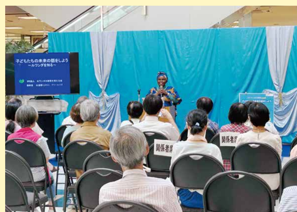
マリルイズさん平和講演会(4地区)