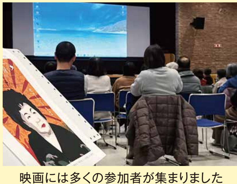
映画には多くの参加者が集まりました

8月だけでなく1年を通して「平和」について考えてほしい。という思いで「平和企画の会」メンバーの有志が集まって実行委員会を発足。今だから見てほしい映画を選び、それぞれの地区で開催しました。当日の、司会や運営など多くの人に協力していただき、500人を超える方に参加していただき、「平和」を考える機会になりました。