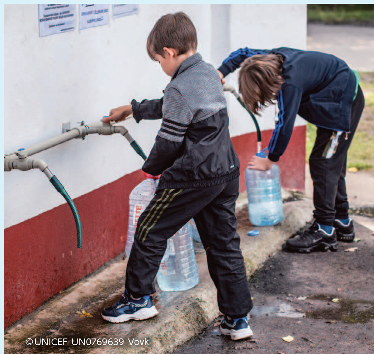
きれいな飲み水が 飲めるように水道の設置