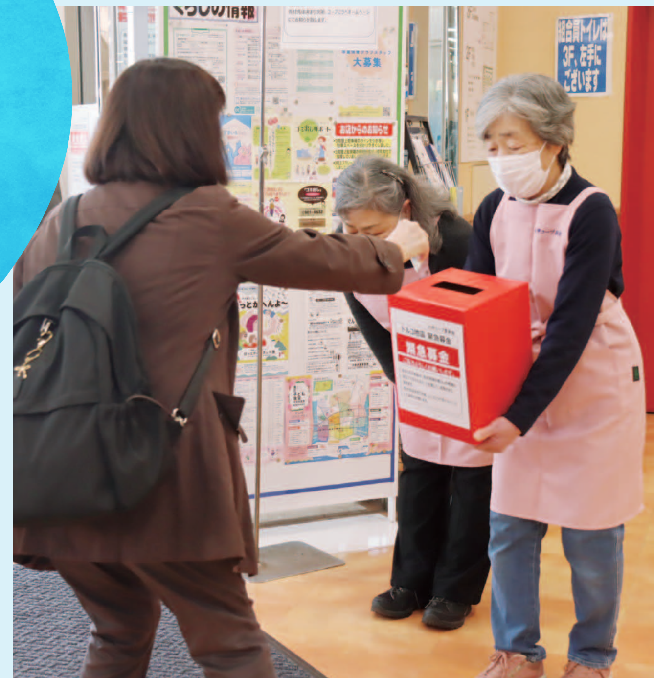
組合員による募金活動