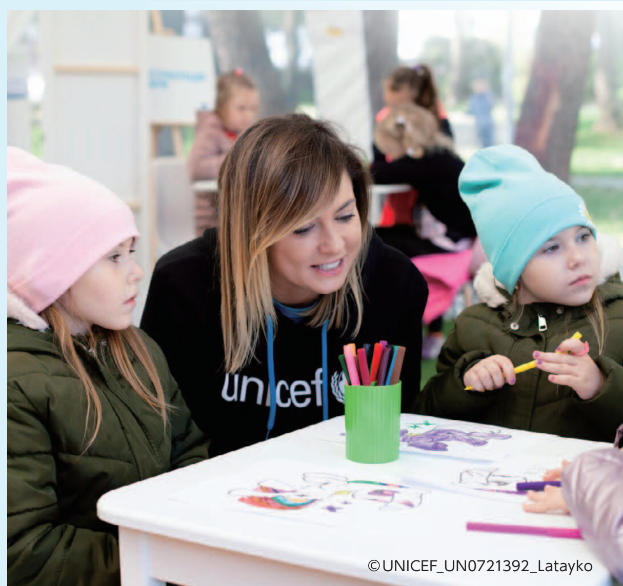
子どもにやさしい シェルターの設置