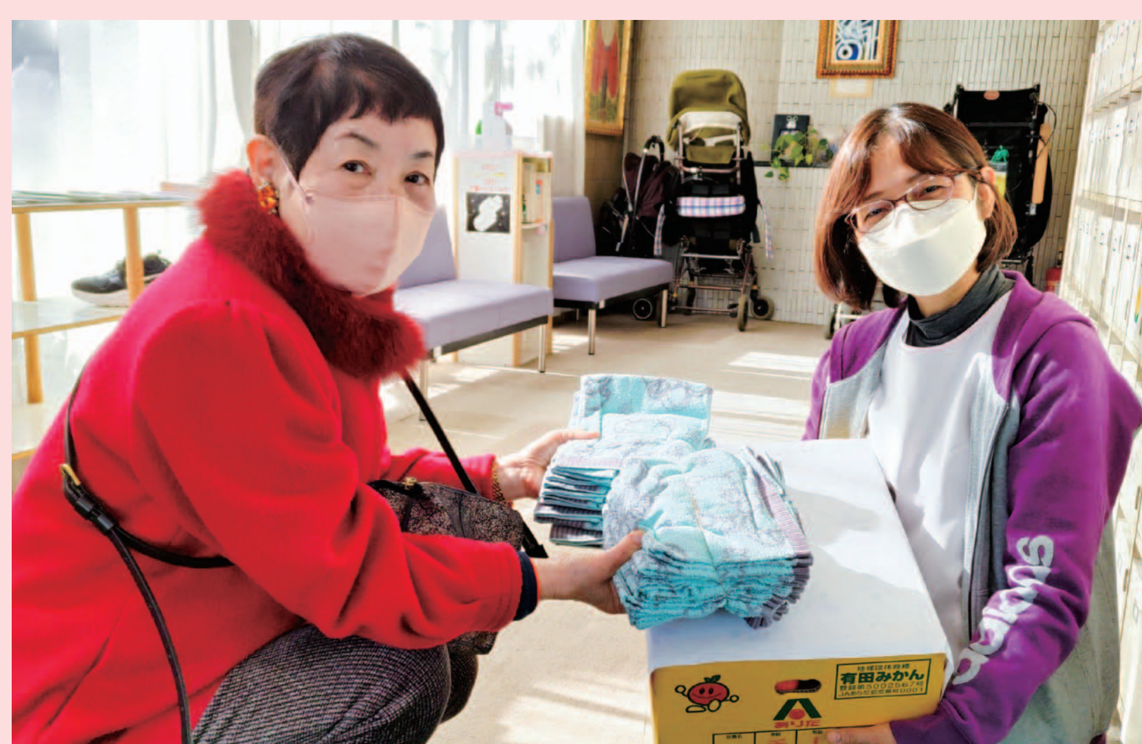
めふコープ委員会から やまびこ園・すみれ園への寄付