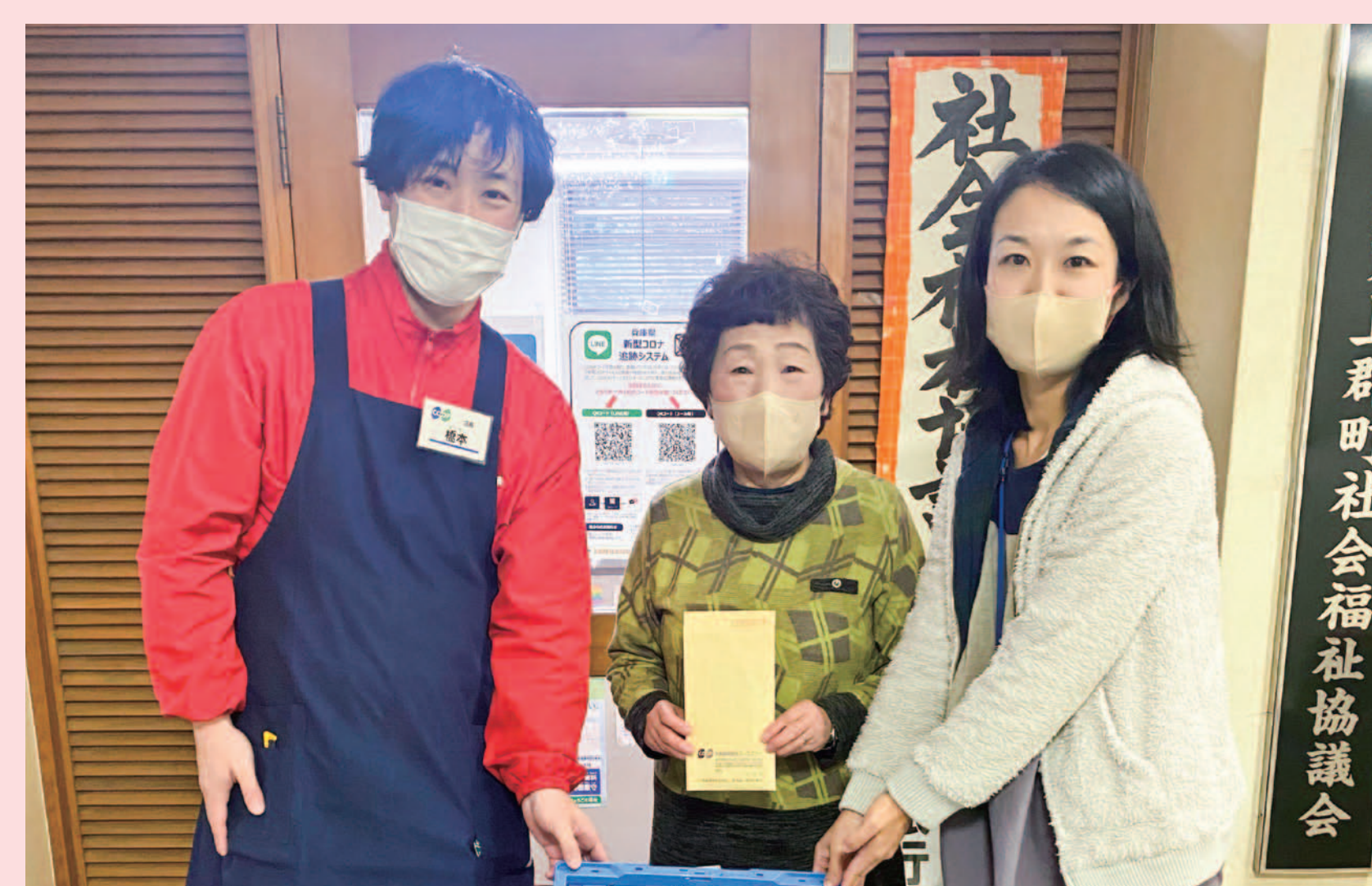
上郡コープ委員会から 上郡町社会福祉協議会への寄付