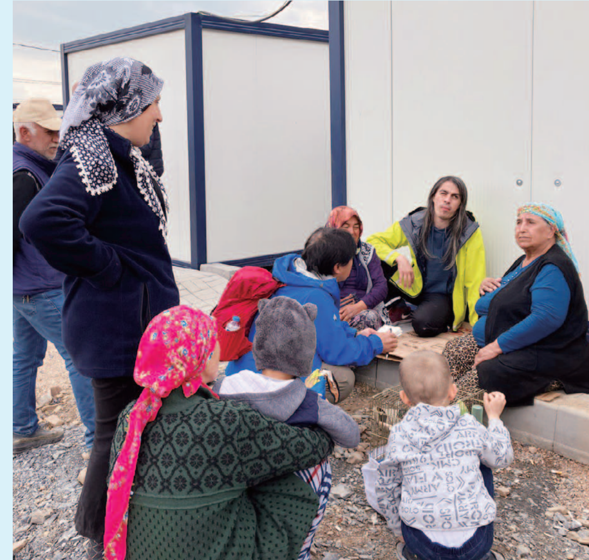
被災地でのヒアリング活動