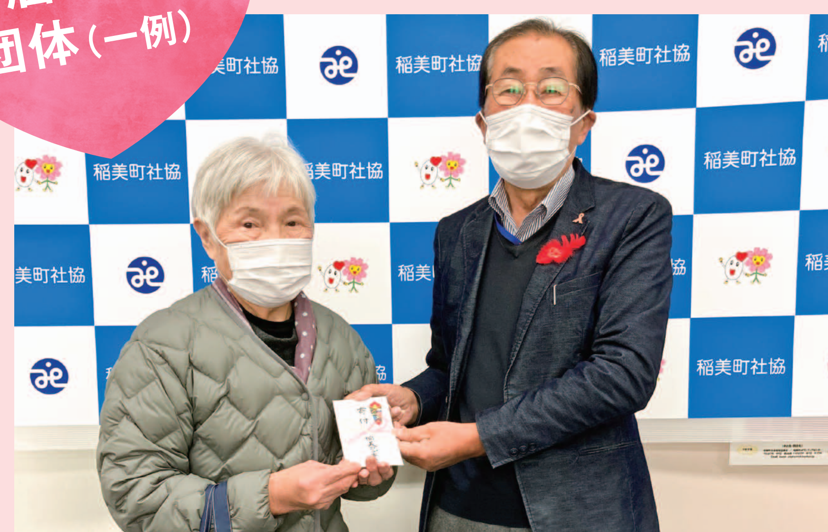
稲美コープ委員会から 稲美町社会福祉協議会への寄付