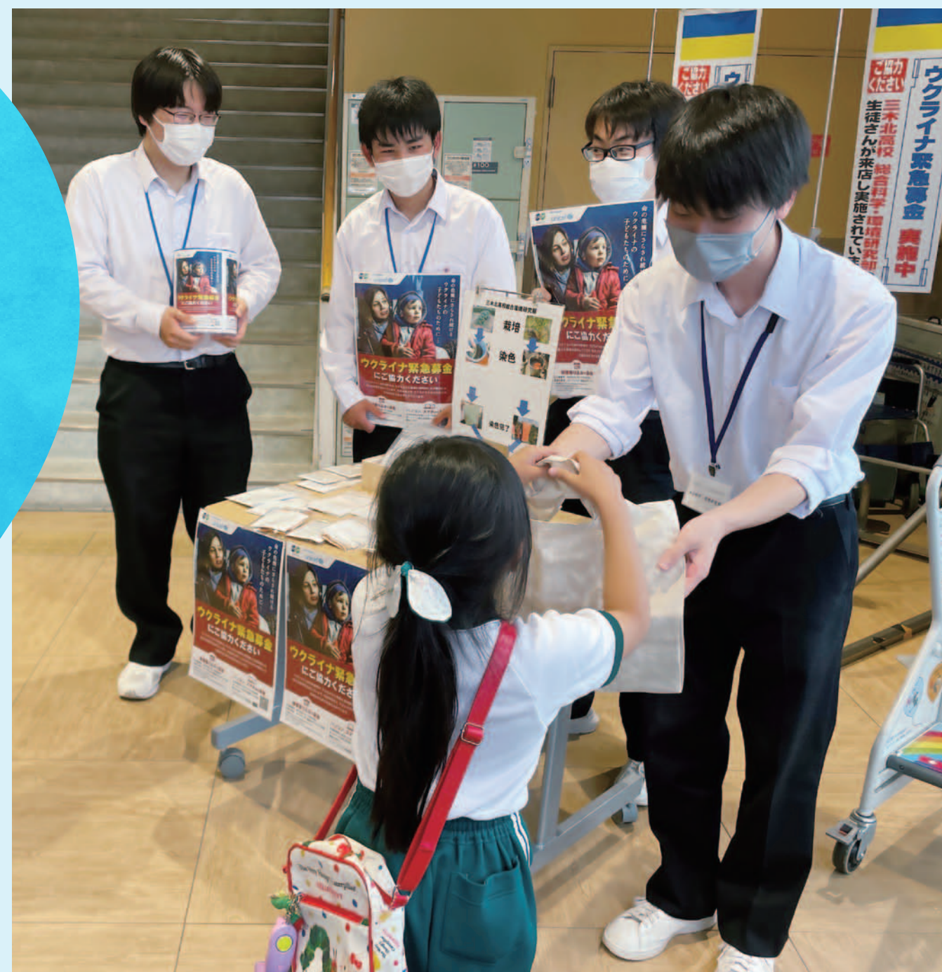
高校生による募金活動