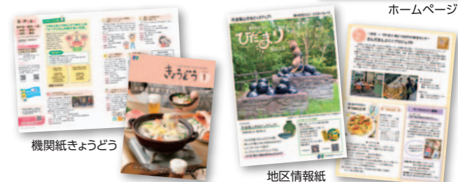
機関紙きょうどう