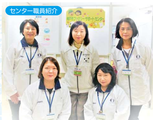
センター職員紹介